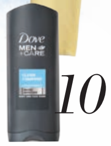
1. Plátenná košeľa, H&M 2. Sada drevených náramkov, Mango 3. Parfum, Ralph Lauren Polo Blue EDP/Douglas 4. Tričko, H&M Loves Coachella 5. Topánky s vymeniteľným suchým zipsom, Dorko 6. Slnčné okuliare, Ray Ban 7. Parfum, David Beckham Aqua Classic EDT 8. Náramkové hodinky, Tommy Hilfiger/Juta Hodinkové šperky 9. Atletické tričko, Mango 10. Sprchovací gél, Dove 11. Nohavice Chino, Zara