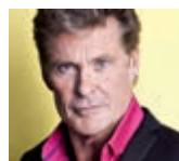
David Hasselhof 17.07.1952