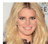
Jessica Simpson 10.07.1980