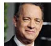
Tom Hanks 09.07.1956

Je tu leto a pražiaci slnko láka k vode. V júli na nás čakajú dni ideálne na relax a nevadí, že sa občas objavia menšie mračná.